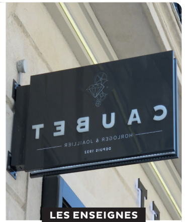
LES ENSEIGNES EN DRAPEAU