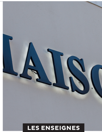
LES ENSEIGNES EN BANDEAU