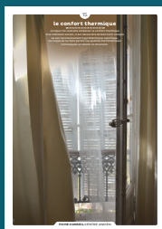
15 le confort thermique