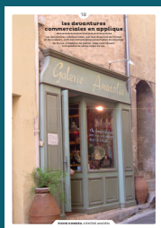
18 les devantures commerciales en applique