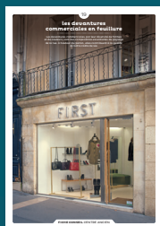
19 les devantures commerciales en feuillure

Qu'ils fassent ou non l'objet d'une protection, les centres anciens sont toujours des espaces de qualité. Chaque intervention sur les façades ou sur les toitures compte et participe à l'harmonie du paysage urbain. Au cœur de nos villes et villages, l'intérêt particulier et l'intérêt général doivent être conjugués pour créer le cadre de vie que nous y recherchons tous.